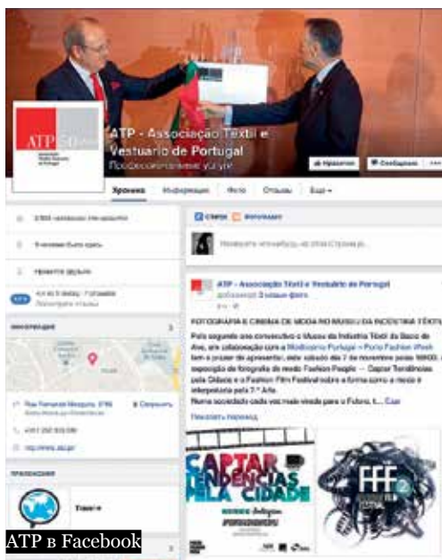
АТР в Facebook

Южноафриканская ассоциация производителей обуви и изделий из кожи (Southern African Footwear & Leather Industries Association – SAFLIA) была создана в 1944 году как Федерация обувных мануфактур ЮАР (FMF), чтобы служить интересам