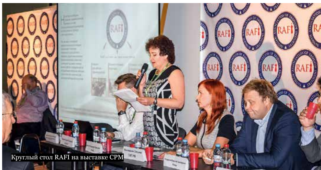
Круглый стол RAFI на выставке СРМ