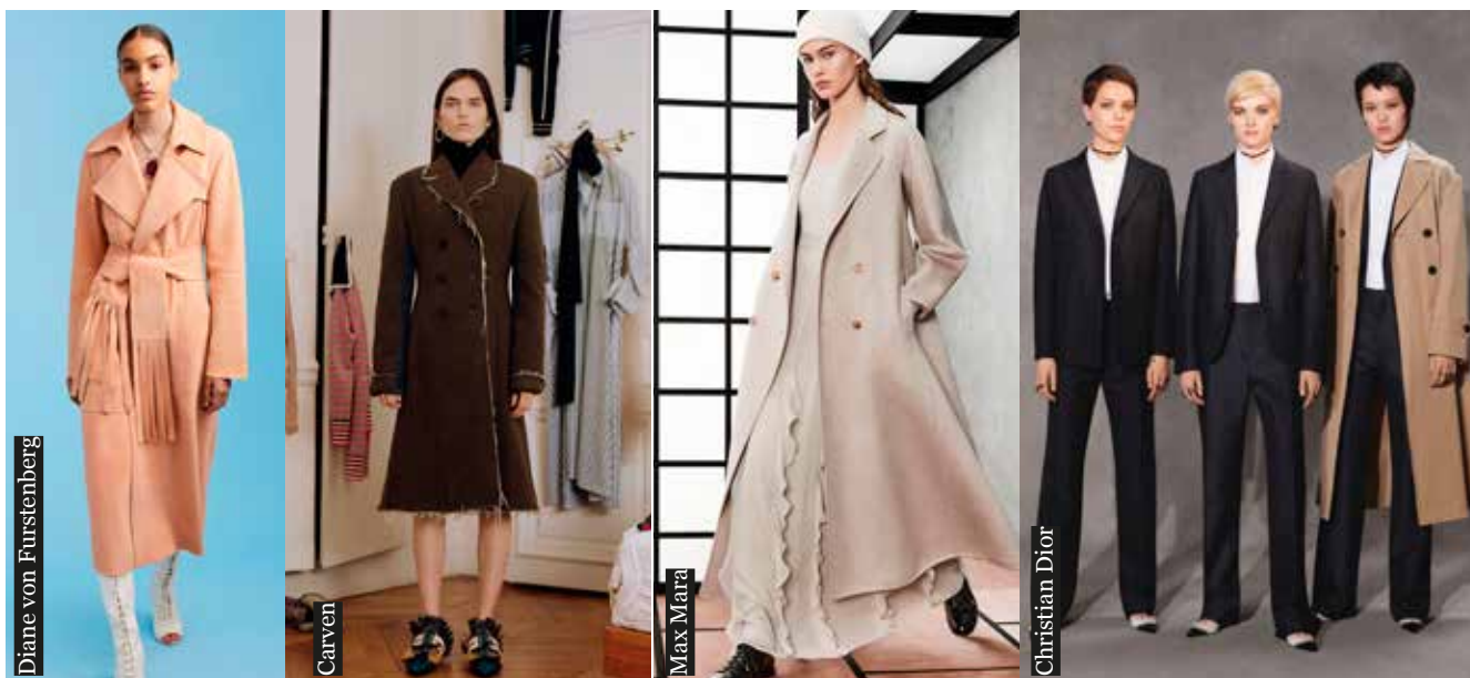
Diane von Furstenberg