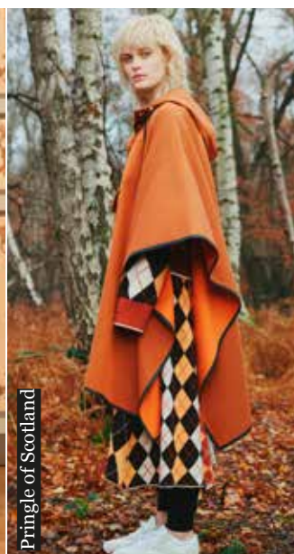
Pringle of Scotland